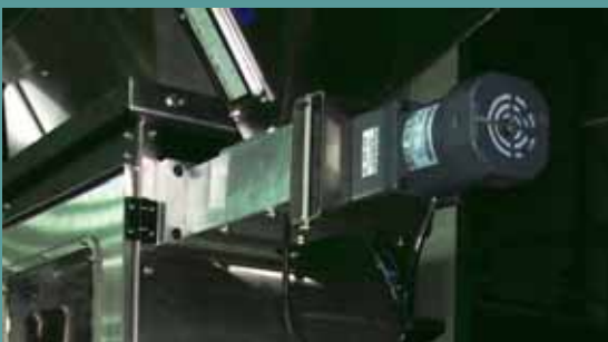
粉體用螺旋餵料機(選配)

Head Office : No.207, Wu Gu Wang N. St., San Chung City 241 Taipei Hsien, Taiwan